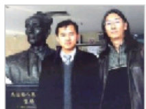
追问音乐意义的存…