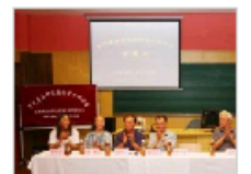
宋代音乐研究国际…