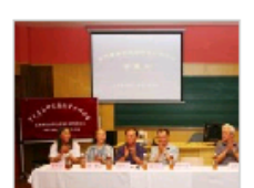
宋代音乐研究国际…