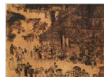
和雇制度在宋代官…