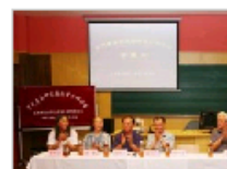
宋代音乐研究国际…