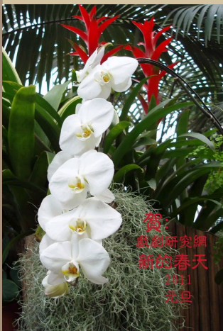
著名戏剧理论家夏 ..