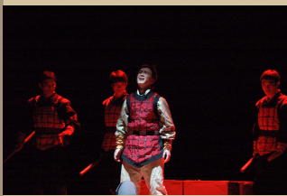
浙江大学黑白剧社2 ..