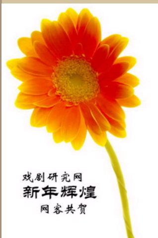
祝戏剧研究网新年 ..