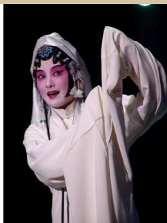
春肠遥断牡丹亭一..