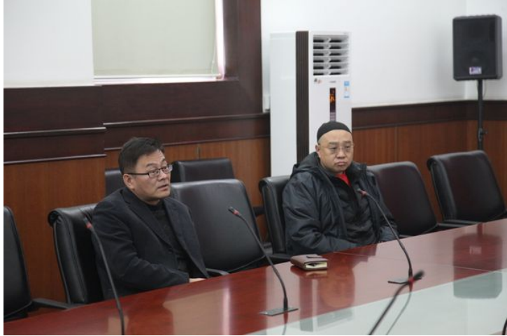
巴图院长向评审专家介绍办班情况