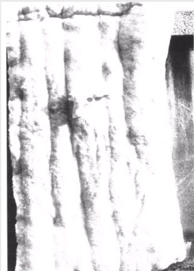
《软档案之一》张雷 综合材料 1997 (第158页)

我们可以说我们对西方现代艺术及其当代的发展有相当的了解,甚至远过于西方学者对中国艺术及当代状况的了解,然而,我们对于西方美术文化建设的知识,却非常贫弱。除了个别艺术家,少有人知道欧洲和美国真正具有影响的画廊、基金会和博物馆,它们推举过哪些艺术家,策划过哪些艺术活动,以及它们如何运作等等。究其原由,乃是中国美术文化建设尚未起步,我们仍然把美术文化看成意识形态领域中的事情,故对相关体制了无兴趣。