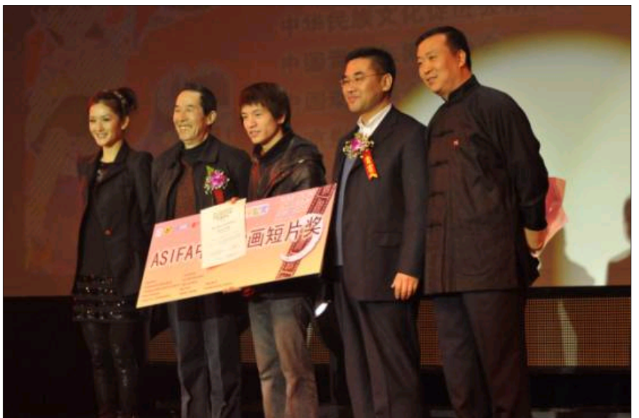
嘉宾给获奖者颁奖