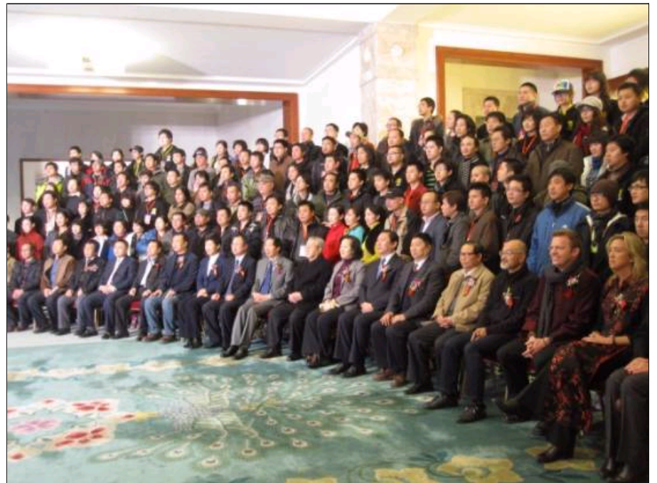
参加开幕式的嘉宾合影留念