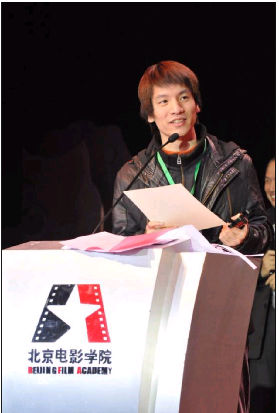
学生发表获奖感言