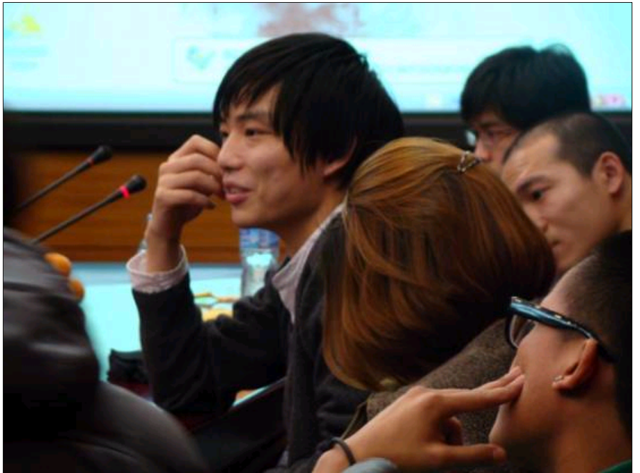
主创人员进行交流