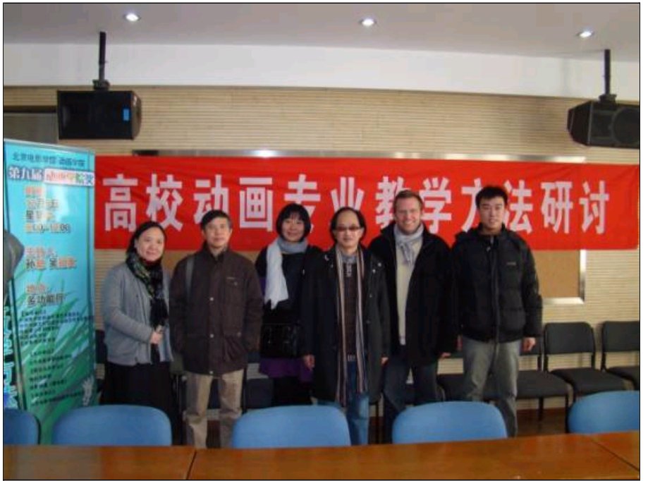
参加“高校动画专业教学方法研讨会”的嘉宾合影