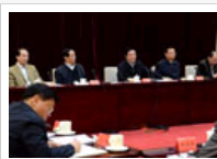
两会新闻宣传总结会议