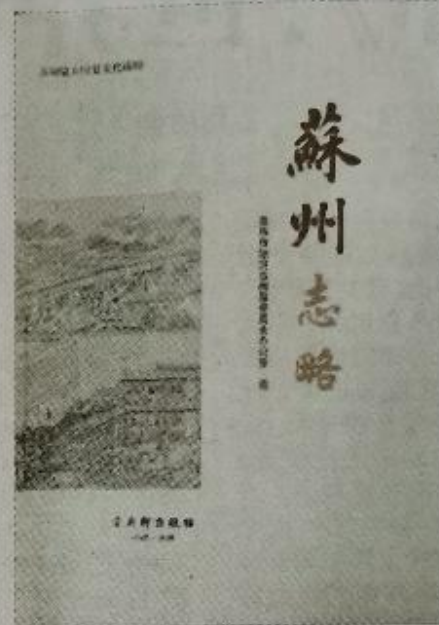
《苏州志略》，苏州市地方志编纂委员会办公室编，古吴轩出版社2019年12月版

苏州文脉绵延千年，厚重的文化底蕴历久不衰。苏州的城市气质是苏州城市知名度与美誉度的基石和根本。苏州评弹昔日曾为帝王弹唱，两百多年来，继承创新，形成了流派唱腔千姿百态的兴旺景象，至今已成为曲艺界一颗璀璨明珠。文艺创作无比繁荣，一批批优秀文学、艺术作品分获中宣部精神文明建设“五个一工程”奖、鲁迅文学