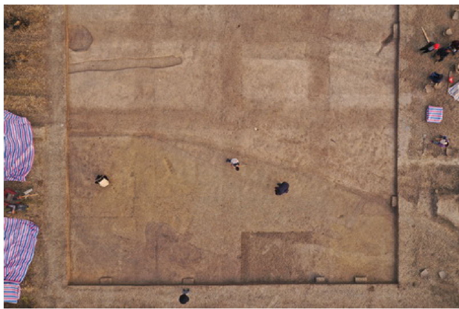
图四 肖家屋脊文化人工堆筑台基初显露

台基与其面上发现的30余个柱洞构成一处大型台基立柱式建筑遗迹,编号F47。该台基由较纯净的黄土筑就,厚度在25-30厘米左右。发掘区内东西皆未至其边界,东西长度超过20米,南北宽约8米,后期人类活动对其有较大破坏。台基面上30余个柱洞遗迹中,有16个西北-东南向一线排布成列,其它柱洞散布于该列柱洞北部,尚未显示出明显的排布规律。依柱洞分布情况看,该建筑遗迹为略呈东西向的长条形建筑,偏角在20度左右,因其东西两边皆已延伸出目前的发掘区,判断其长度不低于23米,宽度则在7米左右。