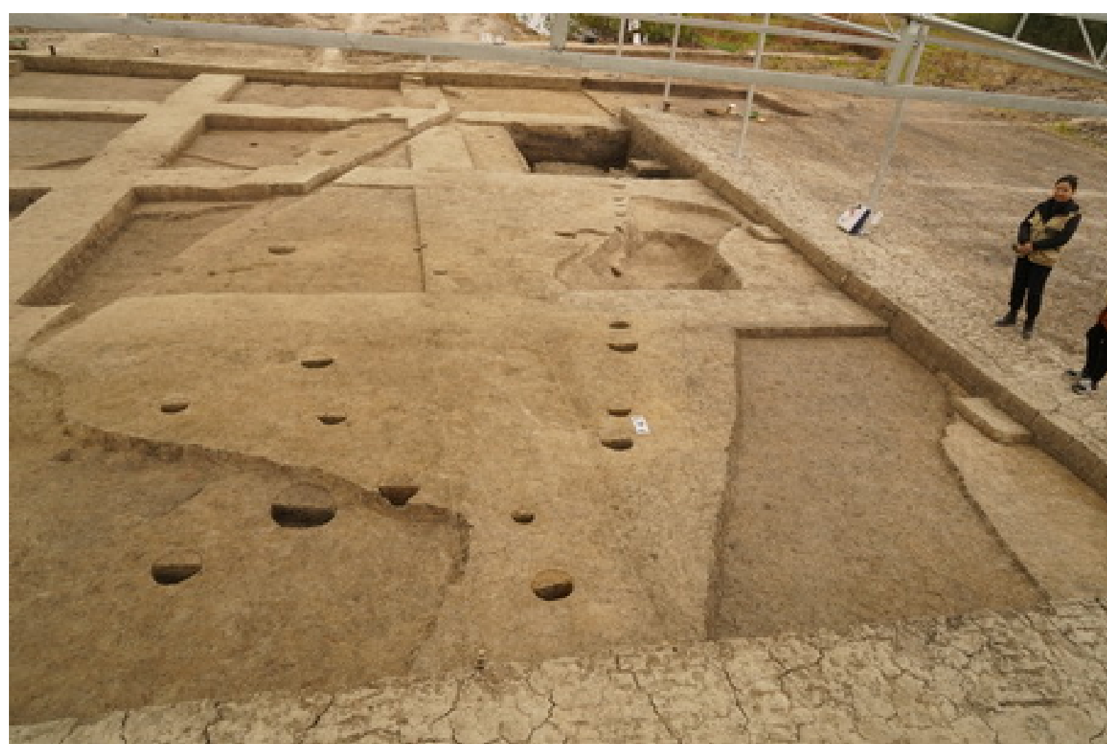
图五 人工堆筑台基及其上的建筑遗迹

因2020-2021年度对遗址南部区域发掘时,揭示出了大型人工堆筑台基和基槽宽度超过1米的大型连间建筑,结合系统钻探所呈现出的遗址整体堆积概况与遗址北部勘探性发掘所揭示出的堆积情况,我们曾推断孙家岗遗址肖家屋脊文化聚落的高规格建筑主要分布在遗址南部,即居址区南北之间可能存在分化。F47的揭示证明遗址北部也有较高规格的大型建筑存在,无疑是深化了我们对孙家岗遗址聚落结构情况的认知。