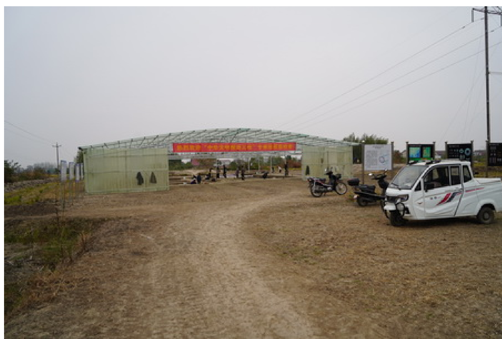
图二 孙家岗遗址2022年度考古工地场景照

考古发掘工作于10月下旬正式启动,截止11月中旬,整个发掘区已全部发掘至肖家屋脊文化堆积层面。最大的收获是揭示出一座规模较大的人工堆筑台基,并在其上发现30余个有一定排布规律的柱洞。