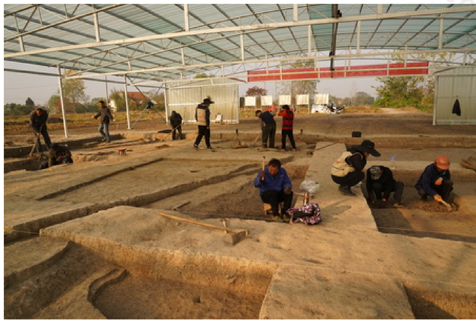
图三 孙家岗遗址2022年度发掘场景

台基与其面上发现的30余个柱洞构成一处大型台基立柱式建筑遗迹,编号F47。该台基由较纯净的黄土筑就,厚度在25-30厘米左右。发掘区内东西皆未至其边界,东西长度超过20米,南北宽约8米,后期人类活动对其有较大破坏。台基面上30余个柱洞遗迹中,有16个西北-东南向一线排布成列,其它柱洞散布于该列柱洞北部,尚未显示出明显的排布规律。依柱洞分布情况看,该建筑遗迹为略呈东西向的长条形建筑,偏角在20度左右,因其东西两边皆已延伸出目前的发掘区,判断其长度不低于23米,宽度则在7米左右。