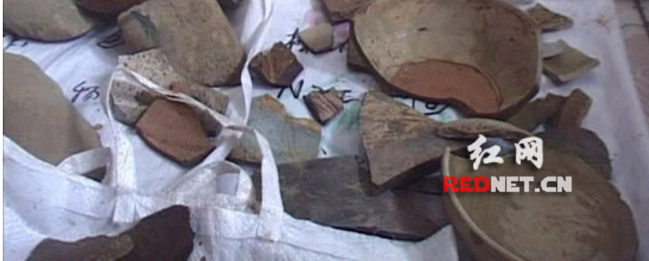
出土的部分缸、盘、钵、罐等器物的残片