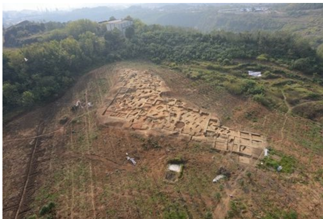
湖北大冶铜绿山四方塘遗址墓葬区航拍

陕西宝鸡周原遗址考古共发掘1座大型夯土基址、1处居址和20多座墓葬、车马坑,并解剖发掘了5处池渠遗迹。呈“回”字形的凤雏三号建筑基址是迄今发掘的规模最大的西周建筑遗址;首次发现的“社祀”遗存意义重大;水系的发现加深了对周原遗址聚落扩张过程与水源关系的认识,填补了周代都邑性遗址给水(池苑)系统的空白。北京大学考古文博学院共有师生60余人参加了该项目,雷兴山教授任领队之一。