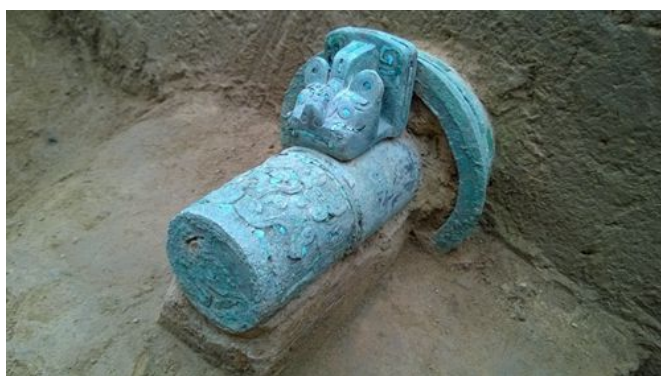
镶嵌绿松石的马车铜制配件

湖北大冶铜绿山四方塘遗址墓葬发掘共清理墓葬135座，这是首次在矿冶遗址发现墓地，不同墓葬随葬品显示不同的劳动分工和技术种类，揭示了矿冶生产的管理者和生产者的相关信息；首次较为完整地揭示了铜绿山矿冶产业链的基本情况，出土的炉渣、铜矿石和铜器为研究铜绿山矿冶生产流程和技术提供了新资料。北京大学考古文博学院陈建立教授带领众师生参与了该项目。