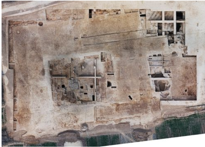
陕西宝鸡周原遗址凤雏三号基址航拍

2016年5月16日下午,“2015年度全国十大考古新发现”名单揭晓,北京大学考古文博学院与其他考古单位合作的两个项目“陕西宝鸡周原遗址”“湖北大冶铜绿山四方塘遗址墓葬区”成功入选。