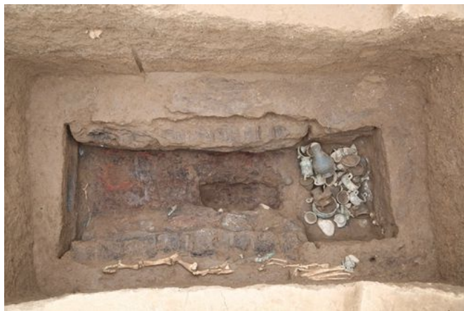
陕西宝鸡周原遗址M11墓葬形制照