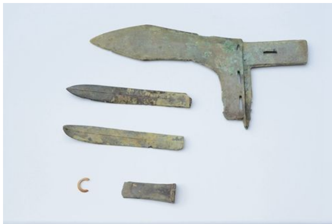
M88出土铜戈、铜刮刀、铜镞、玉饰

“全国十大考古新发现”是由国家文物局委托中国文物报社和中国考古学会举办的评选重大考古发现的活动，其评选标准苛刻，要求严格，入选项目均具有重大的历史、艺术和科学价值。自1990年该评选启动以来，北京大学考古文博学院参与的25个项目获此殊荣，位居国内高校之首。