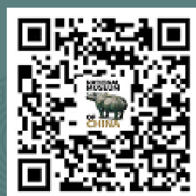
国家博物馆英文版 微信服务号