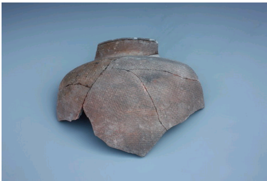
方格米字纹硬陶罐

作者： 发布时间： 2011-06-03 文章出处： 国家文物局 点击率： [354]