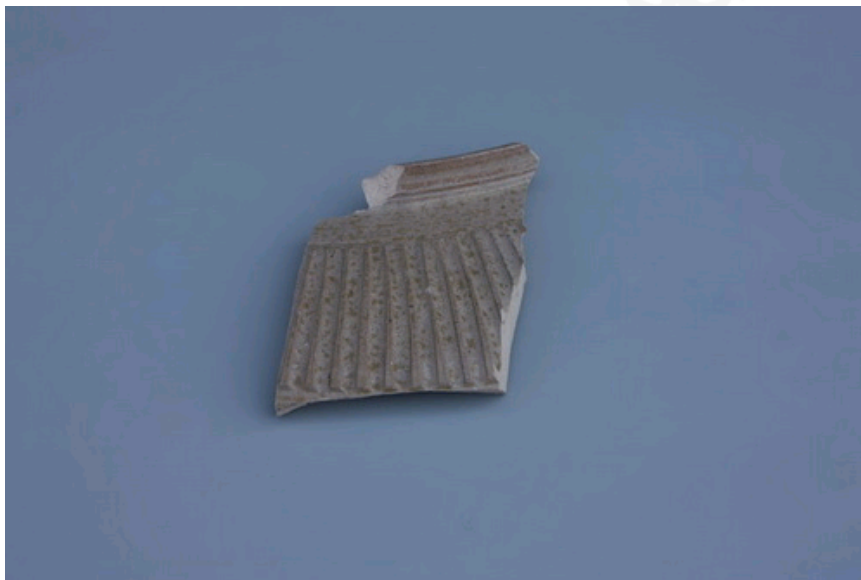
仿青铜礼器原始瓷片

句章故城是宁波历史上最早的城市。按《嘉靖宁波府志》等地方文献记载，句章故城最早为越王勾践所筑，建城时间约在春秋末年、公元前473年（周元王三年）前后，但这一说法并未得到明确的科学证据的支撑。2006年，国家文物局正式批准句章故城考古调查与勘探项目后，宁波市文物考古研究所于2007年11月至2009年6月，先后三次组织考古人员对江北区慈城镇王家坝村一带进行勘探试掘，相继出土了一批汉晋时期的瓦当、板瓦、筒瓦、砖块等建筑构件以及陶、瓷、漆、木类生活用具，并揭露出同一时期的倒塌官署建筑堆积、木构建筑基址等遗迹现象，从而解决了后世文献中关于句章故城地望的争论，确认句章故城的具体位置就在今天的江北区慈城镇王家坝村一带。