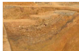
广西贵港考古大发现：旧城区挖出汉代护城壕