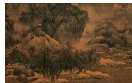
天津博物馆馆藏中国古代书画