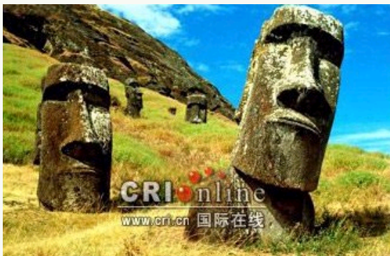
布满石像的复活节岛