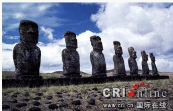
著名的“七尊莫埃”景点