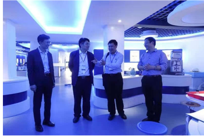
新加坡国立大学苏重豪教授参观物理实验教学中心

中国—新加坡物理学前沿研讨会是由新加坡国立大学和中国内地的著名大学联合举办的系列高水平国际学术会议，至今在新加坡国立大学、中国科技大学、兰州大学、浙江大学、华中科技大学等地举行了14次。会议已经成为了两国物理学界最重要的交流平台之一。在2012年中山大学成功举办第八届新加坡-中国物理学前沿研讨会之后，会议再次选择在中山大学召开，体现了中山大学在国内及国际的影响力，以及作为一带一路关键学术节点的重要性。