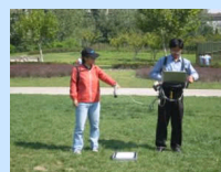
上海技术物理研究所尹