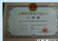
我所“静止气象卫星遥