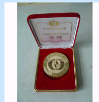
我所实用型模块化成像