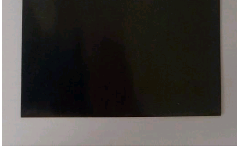
图2 陶瓷太阳能黑色涂层 ( a_s=0.94\pm0.02 , e_T=0.05\pm0.03 )