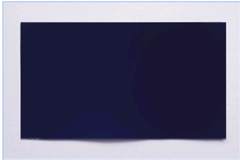
图3 陶瓷太阳能深蓝色涂层 ( a_s=0.95\pm0.02 , e_T=0.05\pm0.03 )