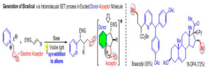
图2 可见光促进的缺电子烯烃双羰基化反应