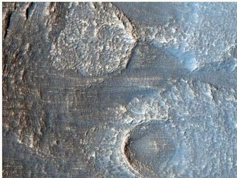
火星上冰川反复沉积后留下的痕迹

据德国《图片报》4月13日报道，近日，研究发现在火星和月球上曾存在水的新证据，这也激发了人类进行新的载人航天探索的热情。