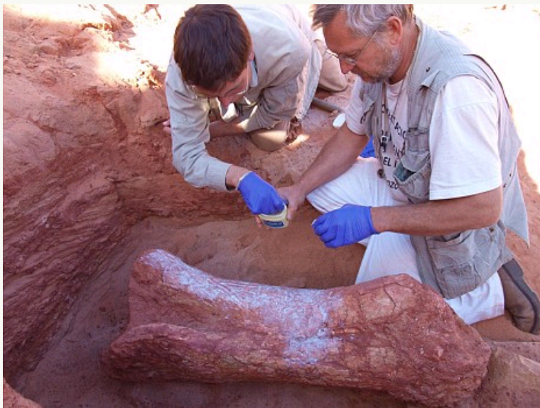
科学家打算将一块儿巨大的骨骼化石搬出