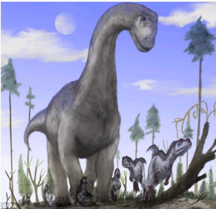
撒哈拉沙漠曾经生活过至少20米长的食草恐龙

据英国《每日邮报》12月17日报道，英国朴茨茅斯大学的戴夫·马迪尔和都柏林学院的奈扎尔·易卜拉欣领导的探险队，在摩洛哥和阿尔及利亚边境地区的撒哈拉沙漠里，发现一条“史前巨生物河”，在河上和岸边生活的鱼类以及其他生物的共同特点就是体型庞大，包括两种新恐龙化石。