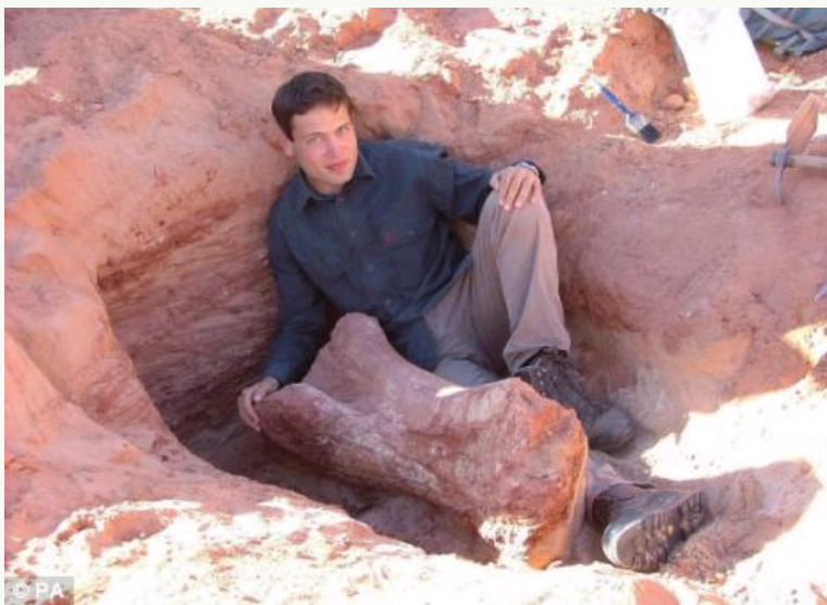
易卜拉欣和大骨头拍照留念