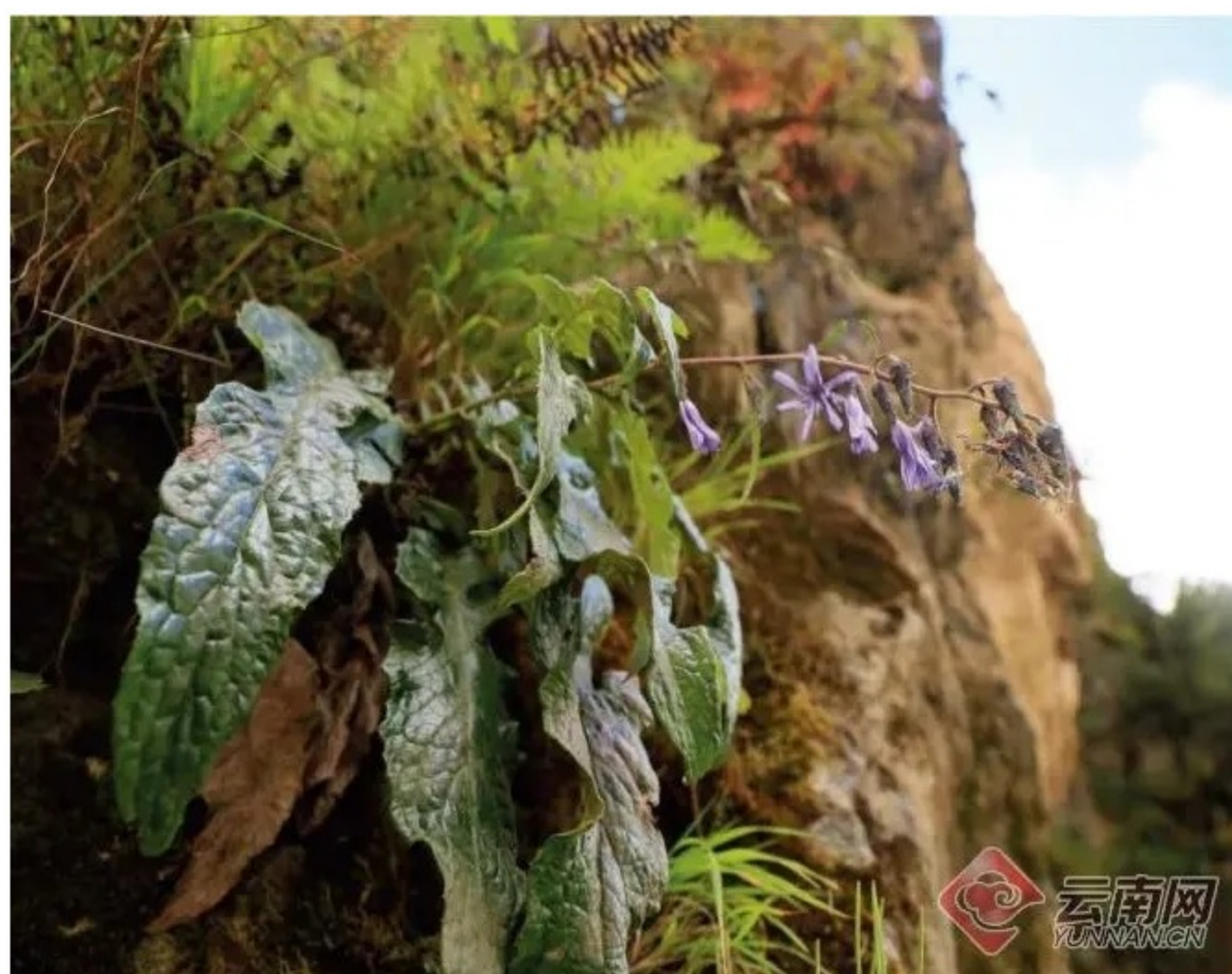
彭氏毛鳞菊 Melanoseris penghuana 供图

记者从云南轿子山国家级自然保护区管护局获悉, 近期, 科研人员在保护区野生药用植物专题调查时, 在保护区内发现一种毛鳞菊属形态奇特的植物, 经贵阳中医药大学王泽欢博士鉴定, 确认为新种。为纪念中国科学院昆明植物研究所彭华研究员长期以来对轿子山保护区植物、植被研究方面的贡献, 该种被命名为彭氏毛鳞菊, 相关成果文章已发表于外文期刊PhytoKeys。