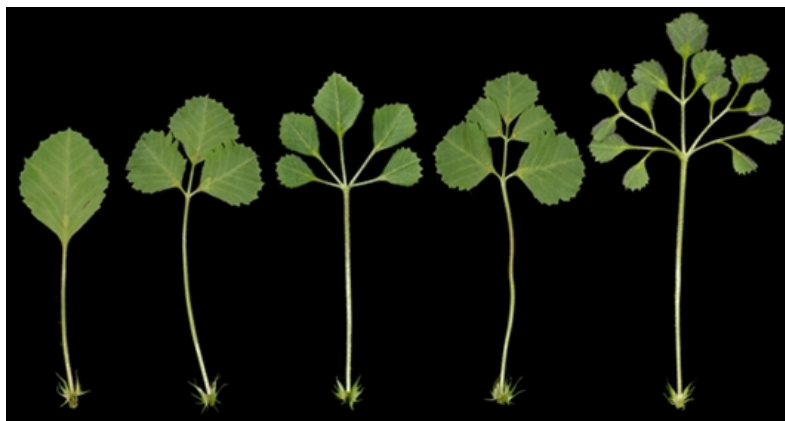
单叶模式 三叶模式 掌状叶模式 羽状叶模式 多级复叶模式 版纳植物园供图