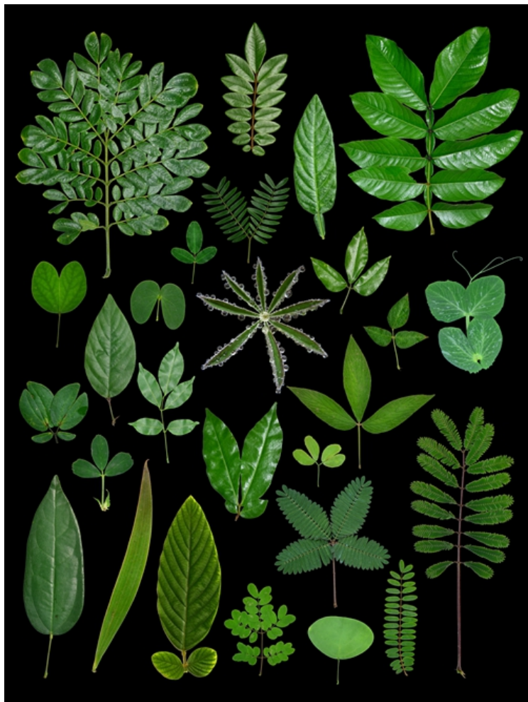
豆科植物叶片多样性。版纳植物园供图