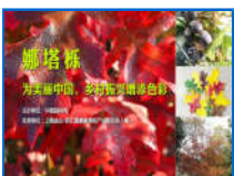
娜塔栎专题分享会之长