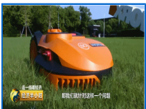
这款国产除草机 占领