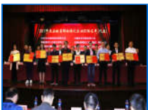
安徽省2017城市园林绿