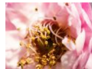
【美丽华农】早春校园