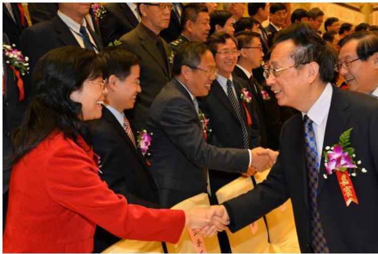
全国人大常委会副委员长陈昌智与金梅林教授（左一）握手

核心提示：10月21日，何梁何利基金2016年度颁奖大会在北京召开，51位中国科学家分获2016年度何梁何利“科学与技术成就奖”“科学与技术进步奖”“科学和技术创新奖”。其中，我校金梅林教授获得“科学与技术进步奖”。