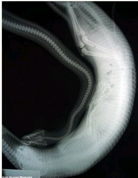
巨蟒吞噬猫后的X射线图