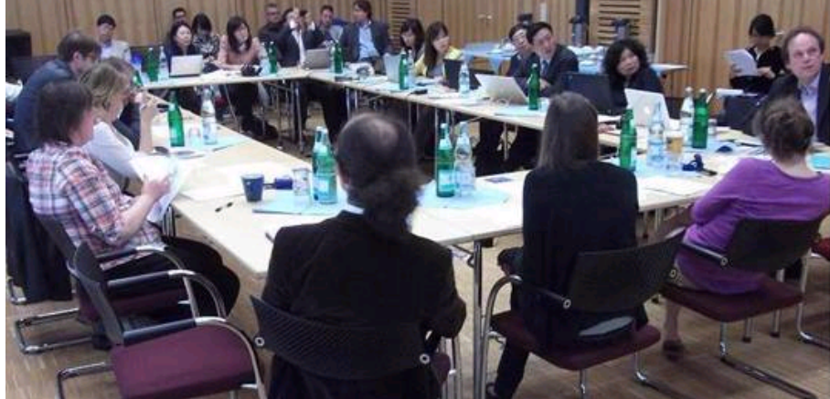
“科技革命与国家现代化”研讨会现场