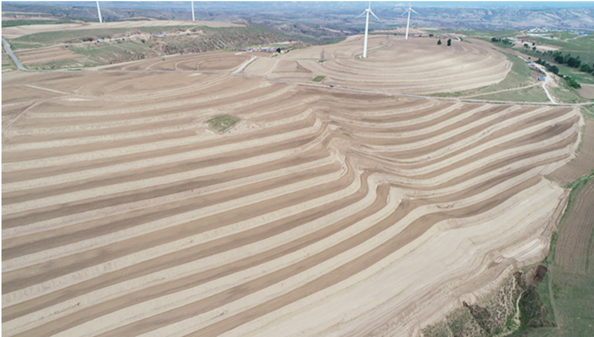
盐池县大水坑镇武家掌先流域