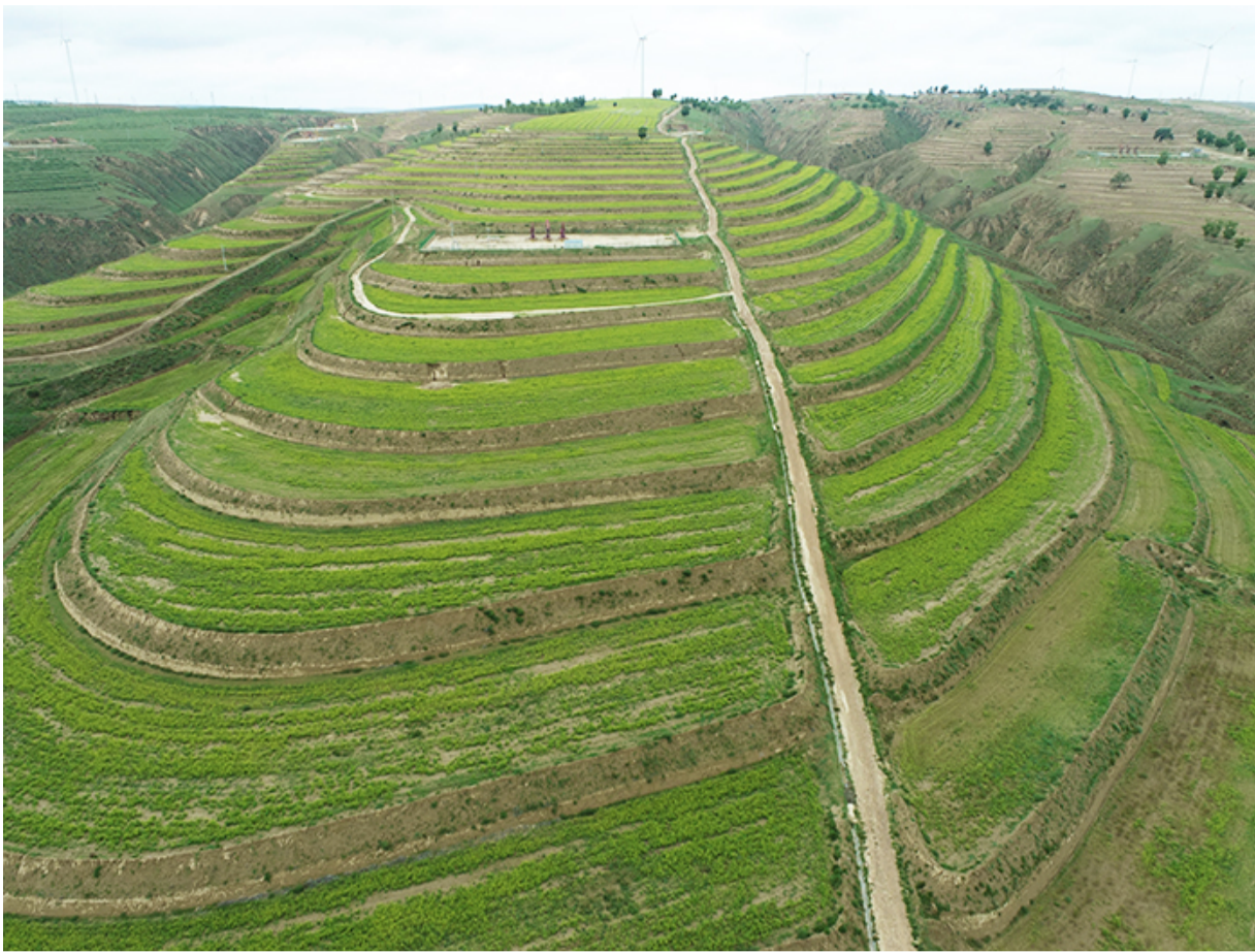
盐池县麻黄山乡马儿庄小流域