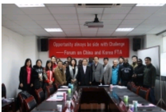
中韩自贸区论坛在南农举行