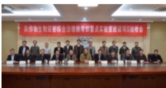
农作物生物灾害综合治理教育部重