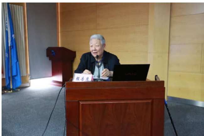
孙家栋院士作特邀报告