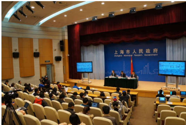
上海市政府举行新闻发布会, 正式发布上海市第二次湿地资源调查情况和结果

上海市第二次湿地资源调查采用3S技术(遥感技术RS、地理信息系统技术GIS和全球定位系统技术GPS)与現地核查相结合的方法, 以2011年福卫二号高分辨率遥感影像为基础, 按照遥感数据室内判读、現地验证和实地调查、室内修正的工作流程, 实施野外调查修验100%覆盖。调查共划定27个湿地区, 完成湿地斑块调查2998个, 重点调查湿地14块, 布设水环境样点46个, 布设植物调查样方2293个, 动物调查样线、样方215个, 拍摄调查照片36197张, 获取成果数据14万余条, 包括湿地类型、面积、分布、受威胁情况和生态状况等方面的信息。