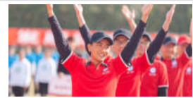
2018年华东师大运动会: 美好未来更...