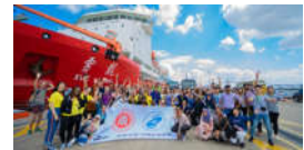
2018“感知中国·中国科考之旅”再...