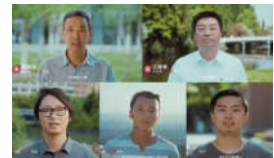
成为更好的大学, 遇见更好的你