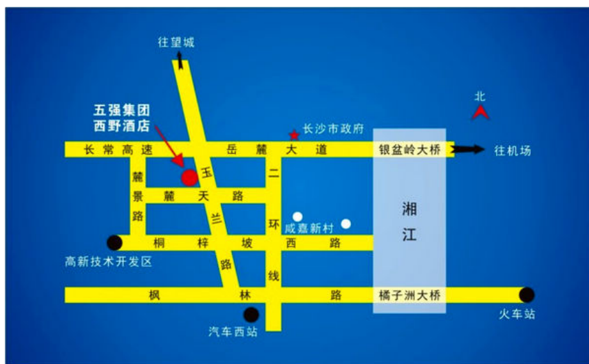
长沙五强商务中心（五强集团西野酒店）位置地图

请参会者认真填写“参会回执表”，10月10日前发送电子邮件到： xxtclhy@sxicc.ac.cn （回执表内容将为通讯录资料，请详细准确填写）。