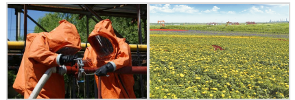
中国石油消防应急救援 绿色开采 和谐共生 围绕实战实训锻造“尖兵”