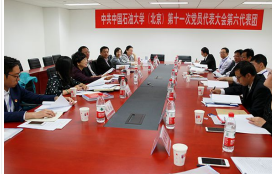
【党代会快讯】中国石油大学第十一次党代会各代表团审议“两委”工作报告