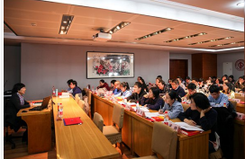
【学习贯彻十九大精神在行动】石大首年教师中国特色社会主义理论培训班开