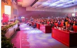
中国石油大学举行第十三届国家奖学金暨企业奖学金颁奖典礼