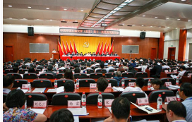
中国共产党中国石油大学(北京)第十一次党员代表大会隆重召开