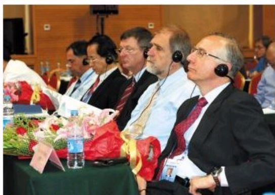
中国工程院外籍院士在听取大会报告。