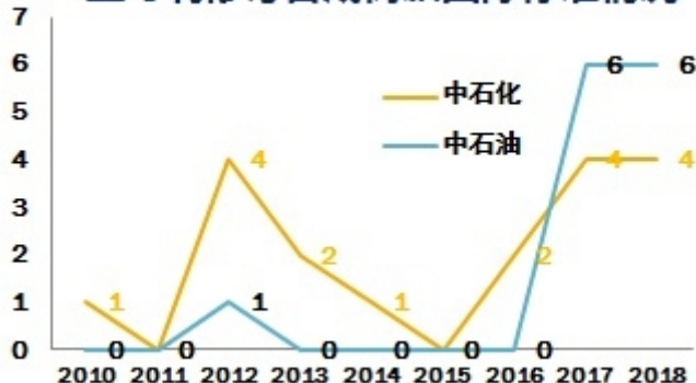
主导制修订合成树脂国际标准情况

2018年,中国石油炼化企业共主导制修订国家和行业标准73项,专业领域涉及合成树脂、合成橡胶、液体燃料、催化剂、塑料管材、化工原料、化工助剂等,标准话语权不断提高。