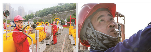
重庆气矿:举措实 供气 寒天热战 稳