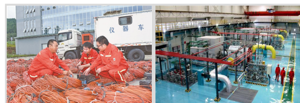
党员带头 项目提速 陕京管道“龙头”高扬