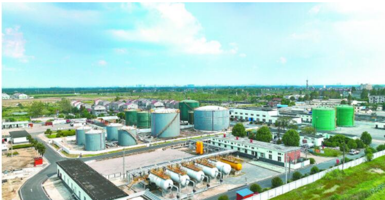
江汉油田江汉采油厂王厂联合站打造“余热+绿电”碳中和示范点。