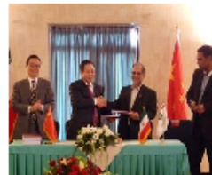
中色股份与伊朗胡泽斯坦