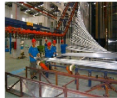
广东华昌铝厂挤压试产开