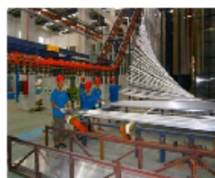
广东华昌铝厂挤压试产开