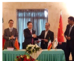
中色股份与伊朗胡泽斯坦