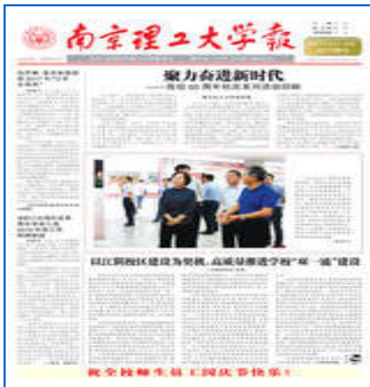
南京理工大学报第1162期