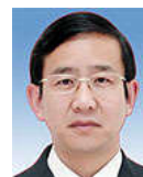
中国锻压协会理事长 第二十二届国际锻造会议主席