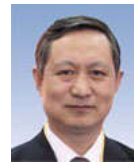
中国锻压协会秘书长 第二十二届国际锻造会议执行主席