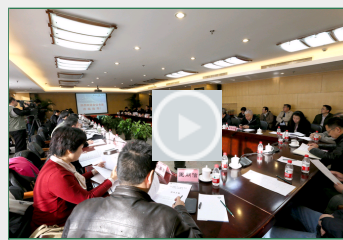
【视频】《京工新闻》——北理工...