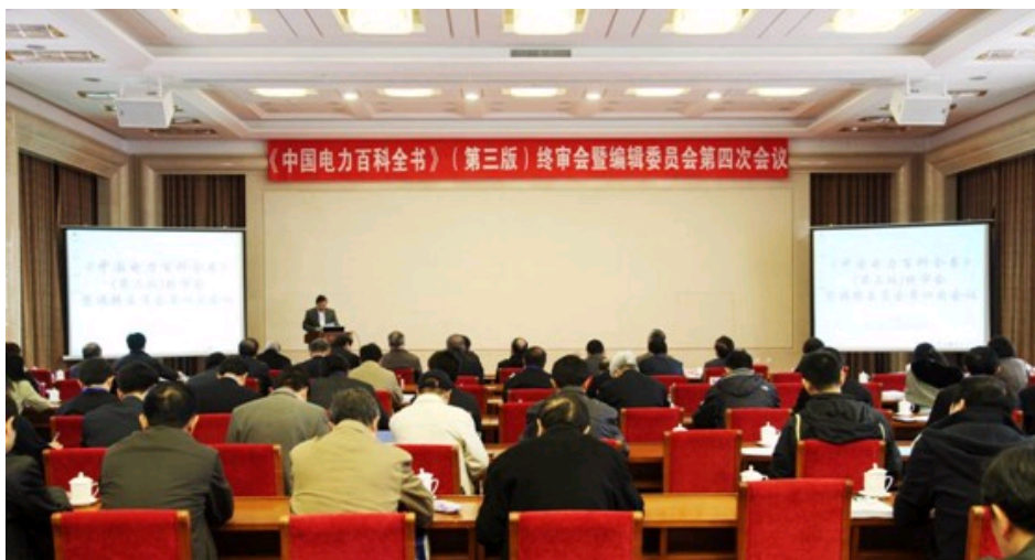
《电百》三版终审会暨编辑委员会第四次会议会场

2013年4月26至28日，《中国电力百科全书》（第三版）（简称《电百》三版）终审会暨编辑委员会第四次会议在北京召开。近150位来自电力行业各领域的顶级专家、学者参加了会议。终审会如期召开，《电百》三版进入终审阶段，标志着修编工作已经接近尾声。