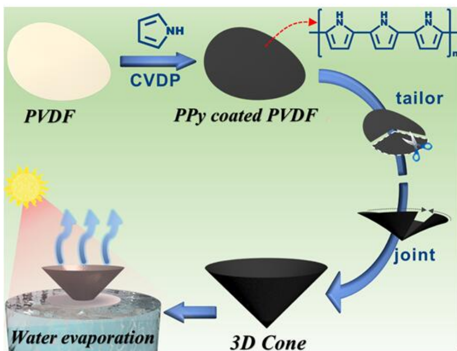
图1. 聚吡咯基3D空心锥形光热膜的制备示意图

http://pubs.rsc.org/en/content/articlelanding/2018/ta/c8ta01469h#!divAbstract