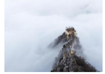
箭扣长城云雾缭绕