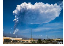
意大利埃特纳火山喷发