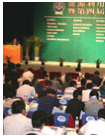
2008中国能源战略高层论坛