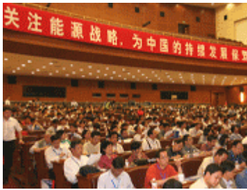
2005中国能源战略高层论坛