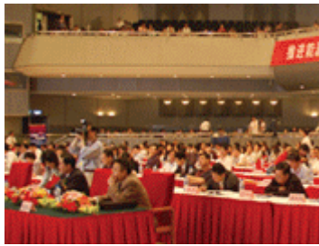
2006中国能源战略高层论坛