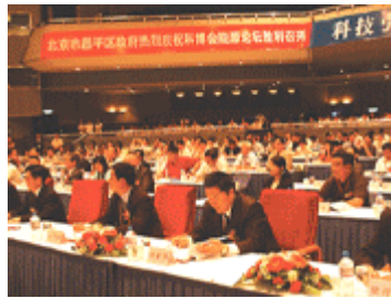
2007中国能源战略高层论坛